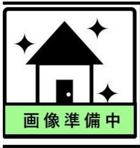
【 2階 】