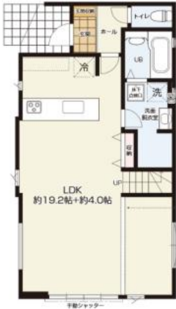
1F / 54.11m 2 (約16.36坪)