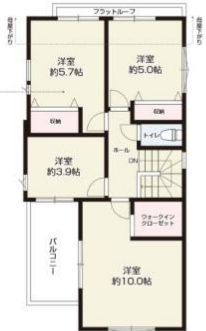
2F / 51.62m 2 (約15.61坪)