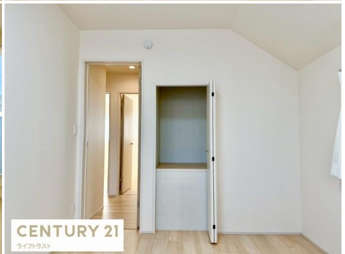
CENTURY 21 ライフトラスト