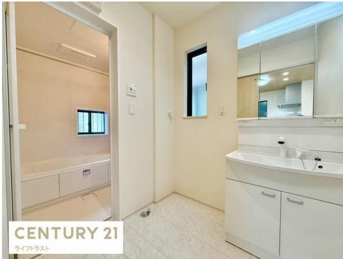
CENTURY 21 ライフトラスト