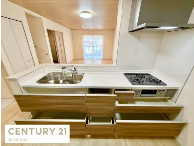
CENTURY 21 ライフトラスト