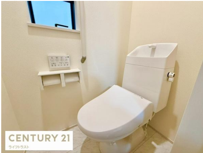
CENTURY 21 ライフトラスト