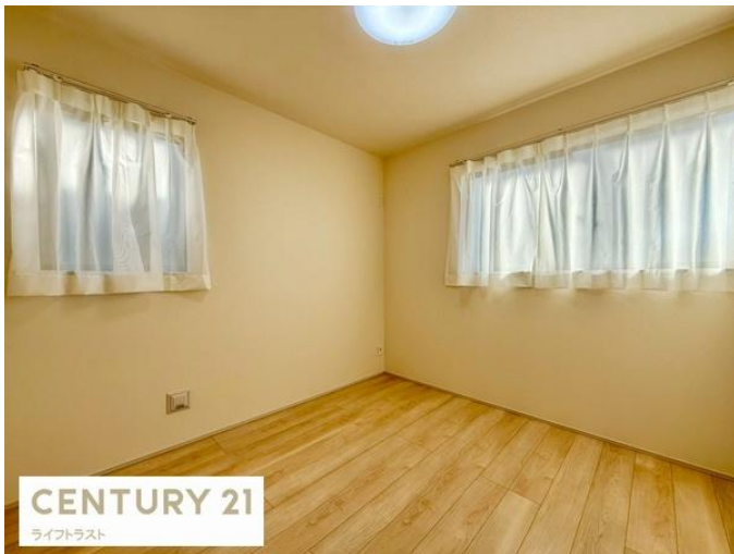
CENTURY 21 ライフトラスト