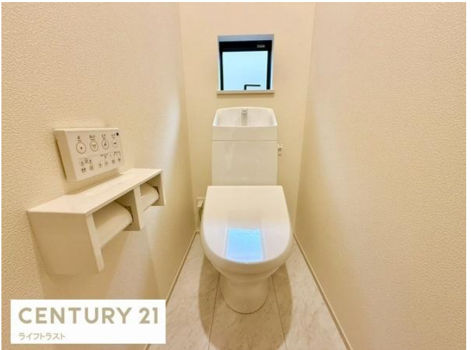
CENTURY 21 ライフトラスト