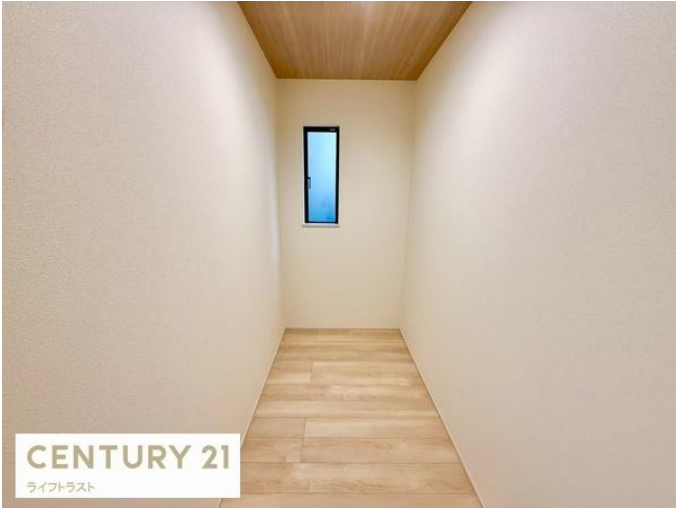
CENTURY 21 ライフトラスト