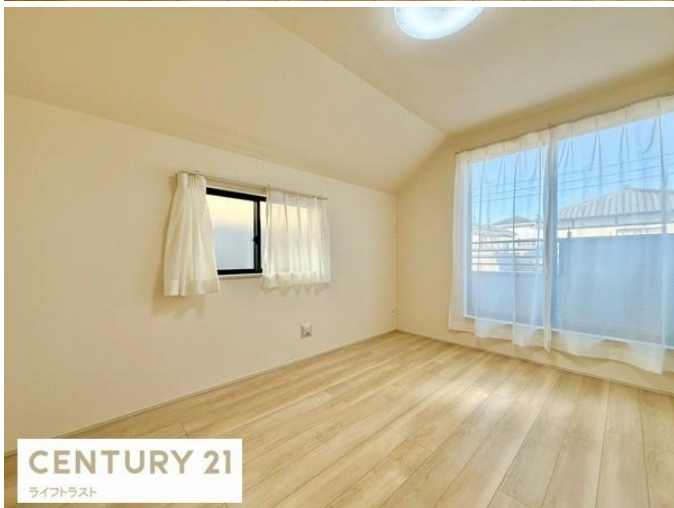
CENTURY 21 ライフトラスト