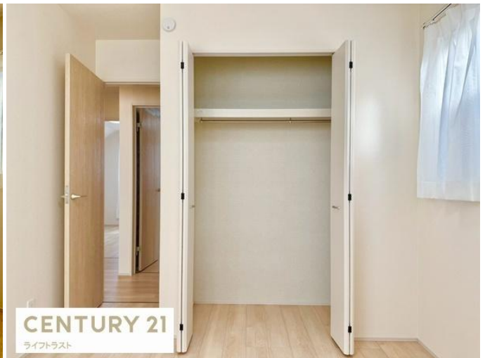
CENTURY 21 ライフトラスト