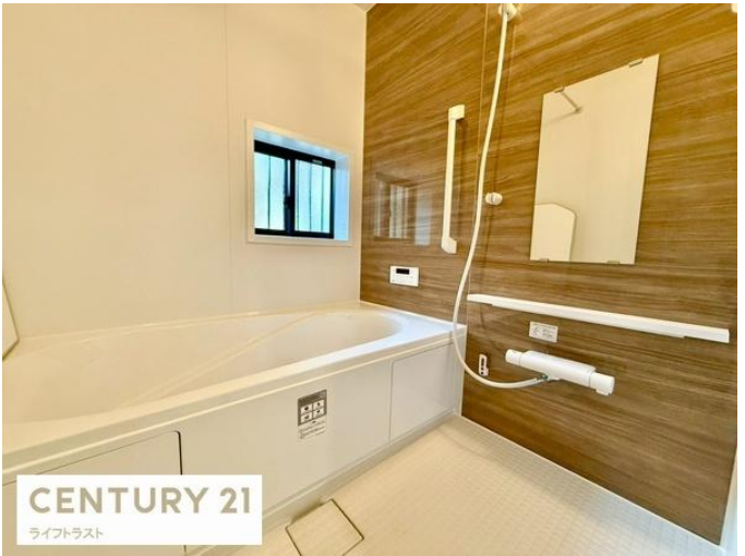
CENTURY 21 ライフトラスト