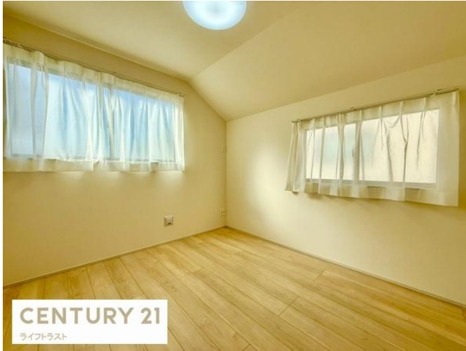
CENTURY 21 ライフトラスト