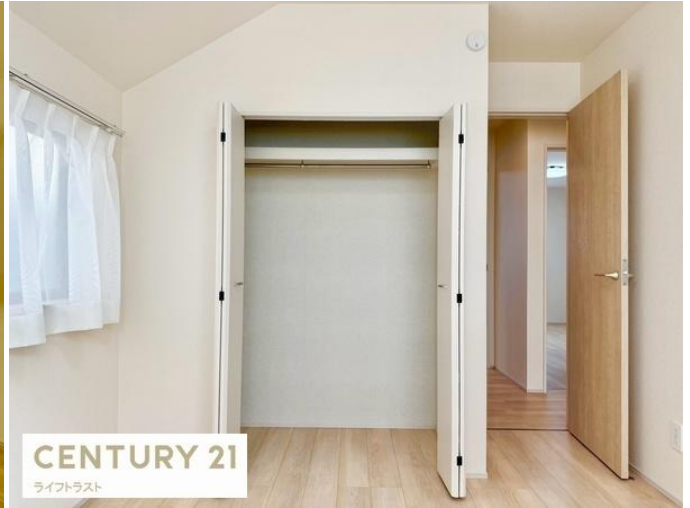
CENTURY 21 ライフトラスト