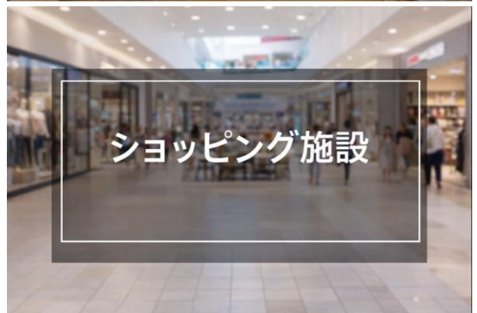
ショッピング施設