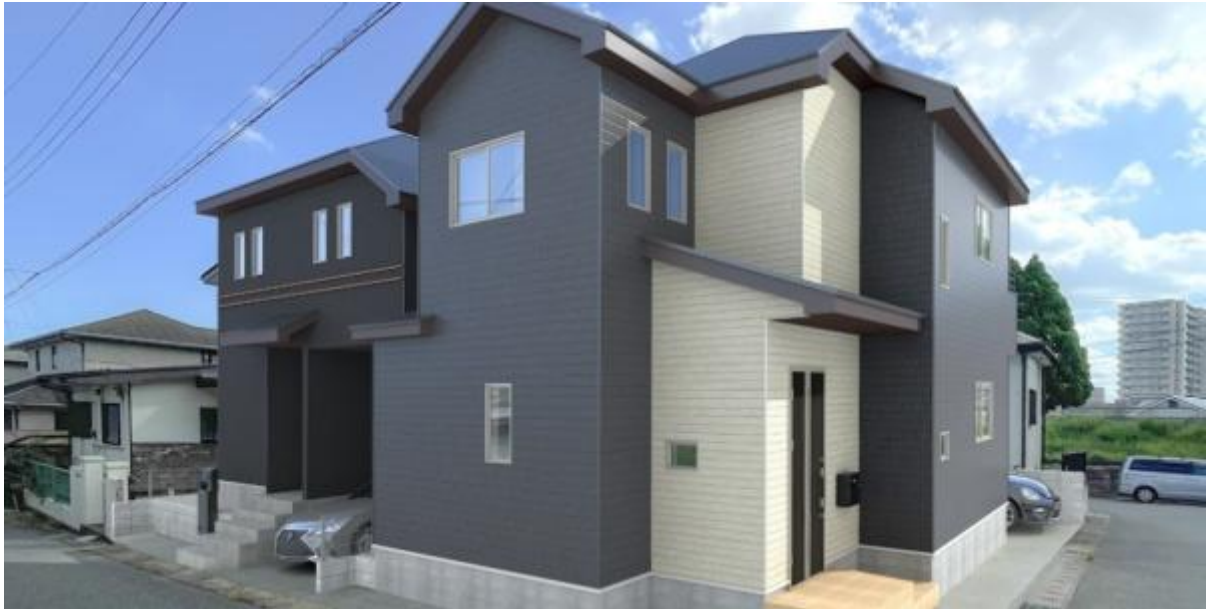
4LDK+ビルトインガレージ