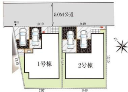
2号棟 4LDK+WIC+SC +リネン庫