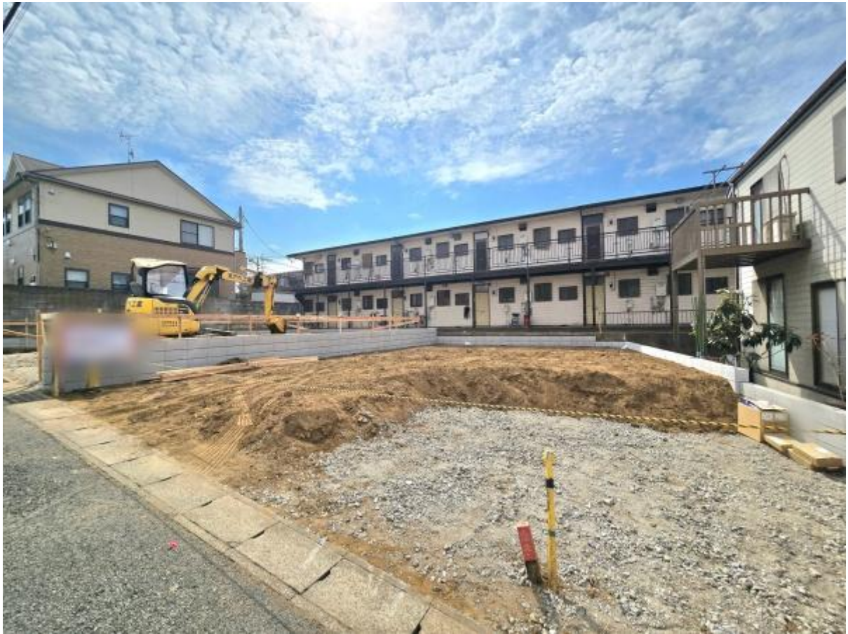
1号棟 4LDK+WIC +SC

弊社専属ファイナンシャルプランナーがお金に関するあらゆる質問にお答えいたします！住宅ローンはお任せください！金利の安い最適な金融機関をご紹介します！便利な浄水器付き水栓です。雨の日のお洗濯にも大活躍な浴室乾燥機付