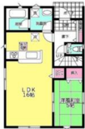
1 F :50.62㎡