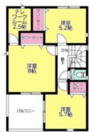
2 F :45.36㎡ (別途ルーフバルコニー部分7.29㎡)