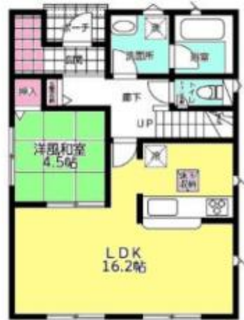
1 F :52.24㎡