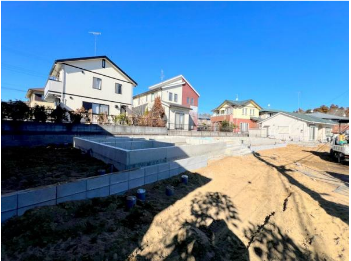
1号棟 4LDK ■敷地面積/204.44㎡(61.84坪) ■延床面積/98.82㎡(29.89坪)