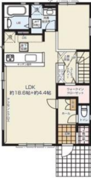
1F / 56.51㎡ (約17.09坪)