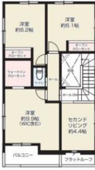
2F / 52.64㎡ (約15.92坪)