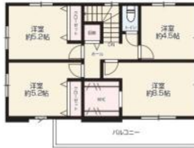
2F / 49.97m 2 (約15.11坪)