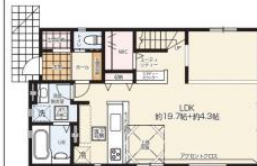
1F / 58.17m 2 (約17.59坪)