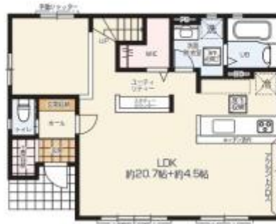
1F / 58.38m 2 (約17.65坪)