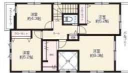
2F / 50.84m 2 (約15.37坪)