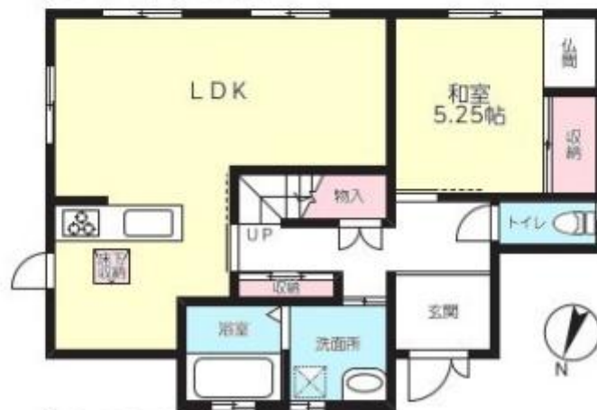
【1 F 平面図】