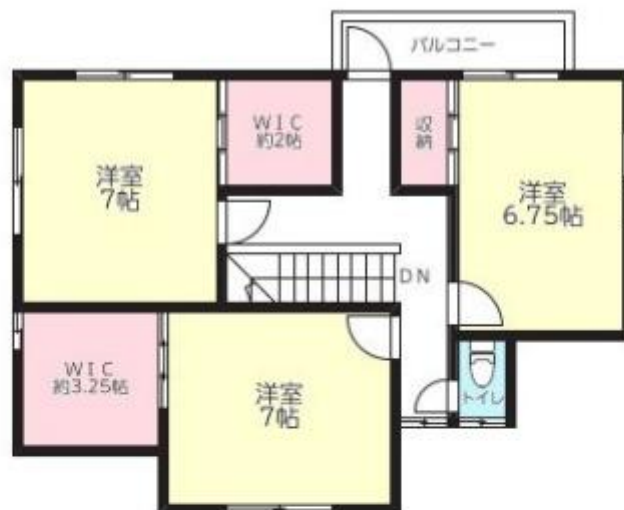
【2 F 平面図】