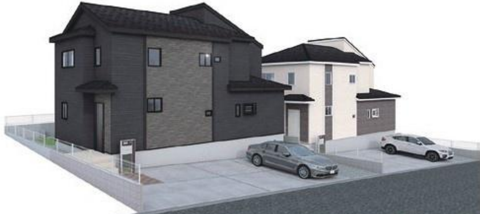
イメージパース※このイラストは図面を基に描きおとしたもので実際とは多少異なります。

弊社専属ファイナンシャルプランナーがお金に関するあらゆる質問にお答えいたします！住宅ローンはお任せください！金利の安い最適な金融機関をご紹介します！閑静な住宅街につき住環境良好です！