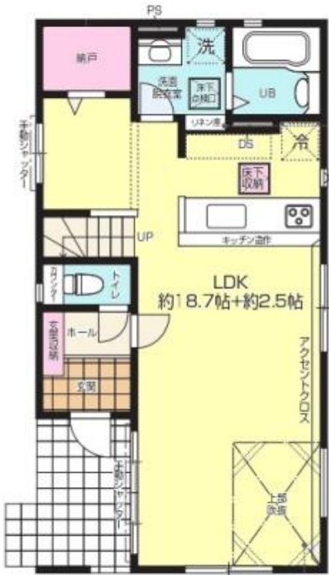
1F / 51.75 m 2 (約15.65坪)