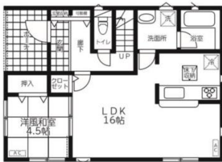
1F: 51.84m 2