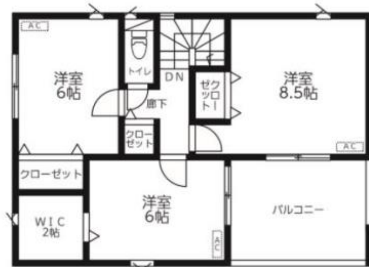
2F: 46.98m 2 (ルーフバルコニー 9.72m 2 )