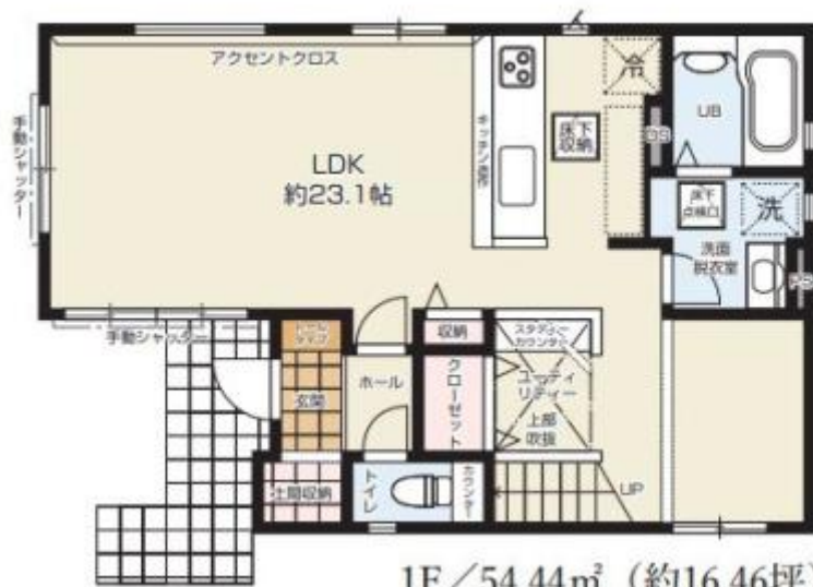
1F / 54.44m 2 (約16.46坪)