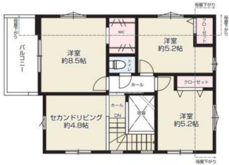
2F / 49.14m 2 (約14.86坪)