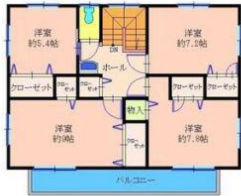
【2F : 70.00㎡】