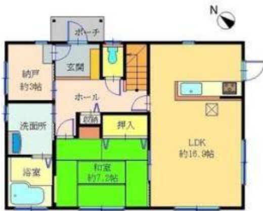
【1F : 70.00㎡】